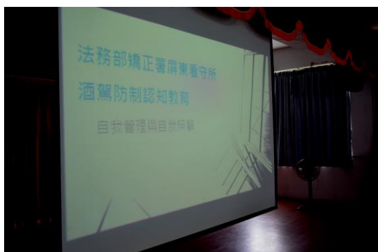
說明自主健康管理之重要性