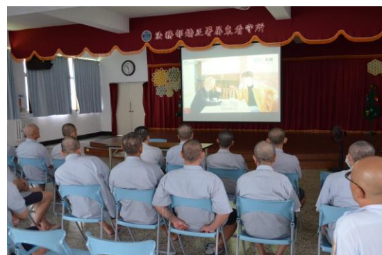
認知教育課程剪影