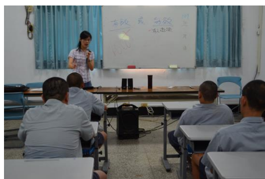
討論戒酒「有效」與「無效」之思維