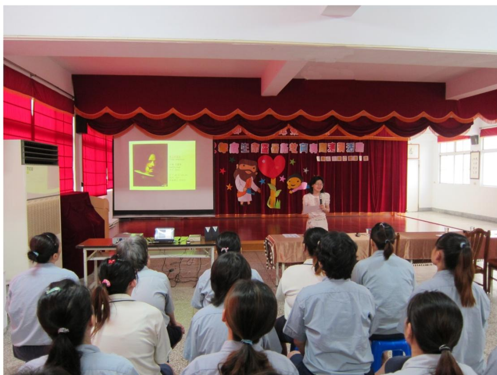
講座介紹著名藝術家生命歷程