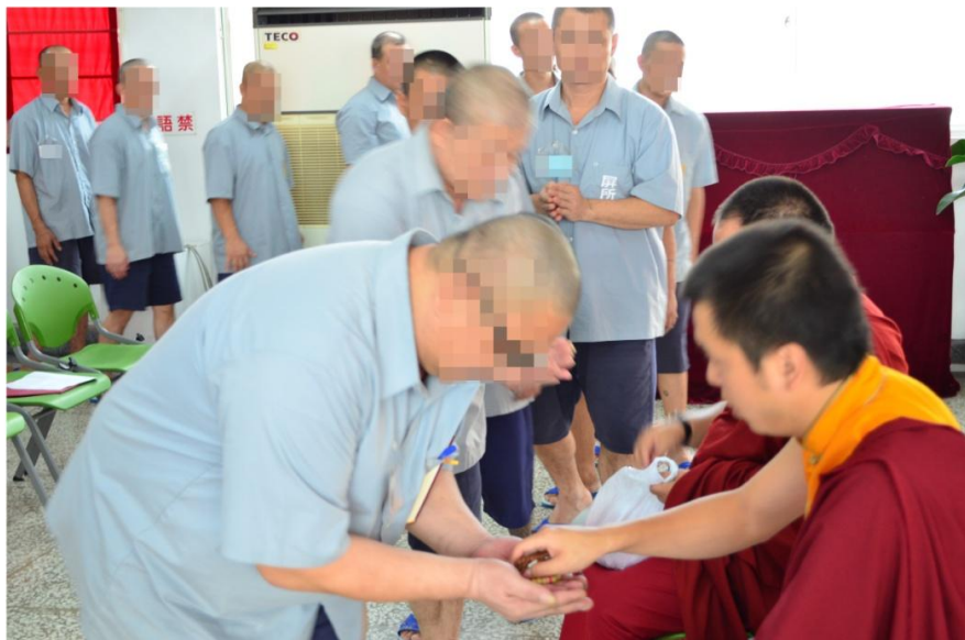
善曼仁波切為收容人祈福之情形