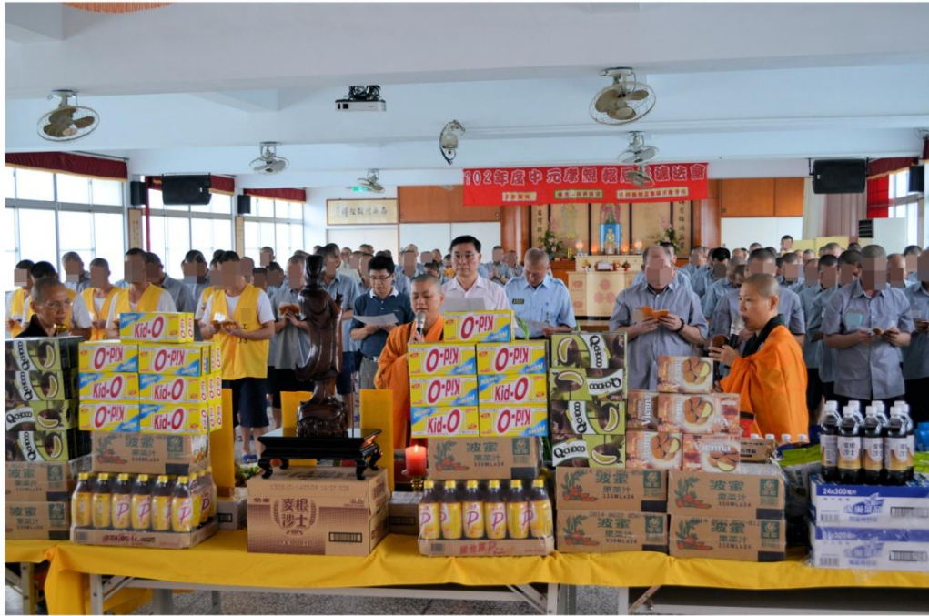
妙璋法師主持普渡法會情形