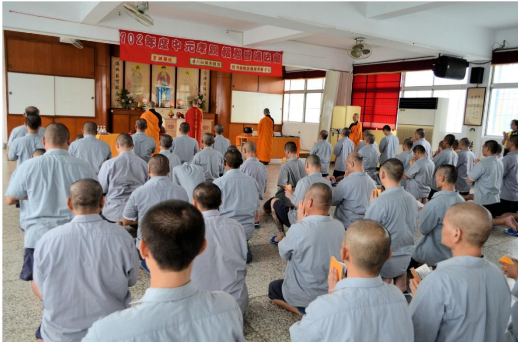
收容人虔誠讀誦經文為自己及家人懺悔祈福之情形