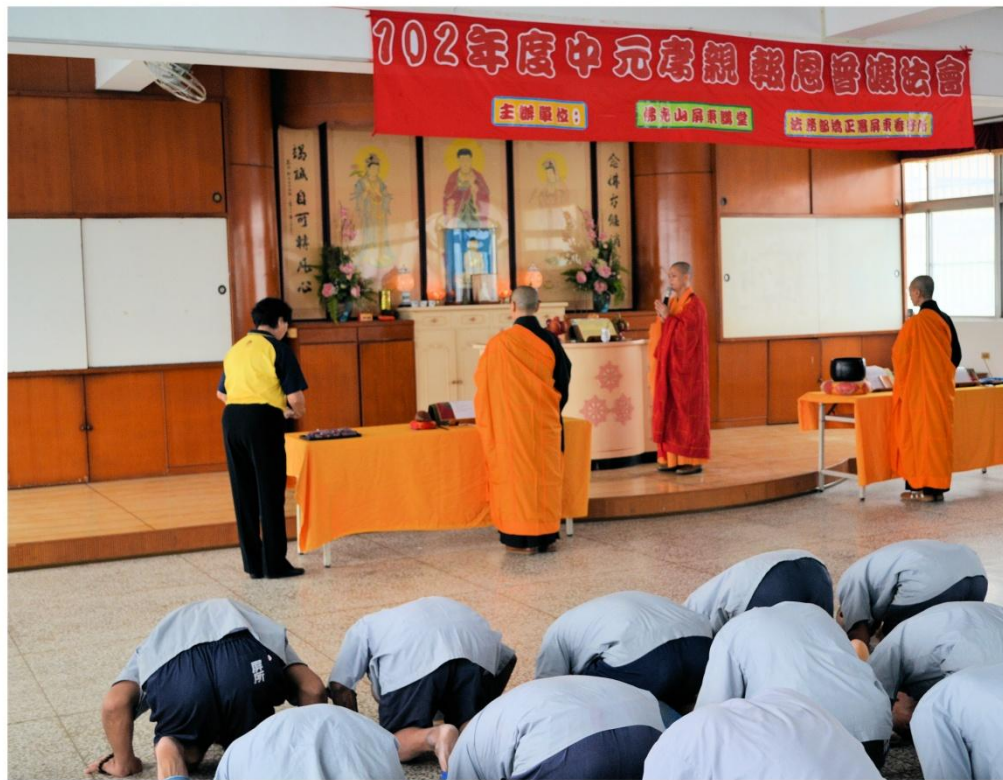
收容人虔誠禮佛、禮敬三寶之情形