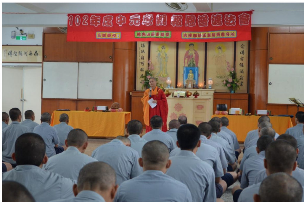
妙璋法師為收容人開示之情形