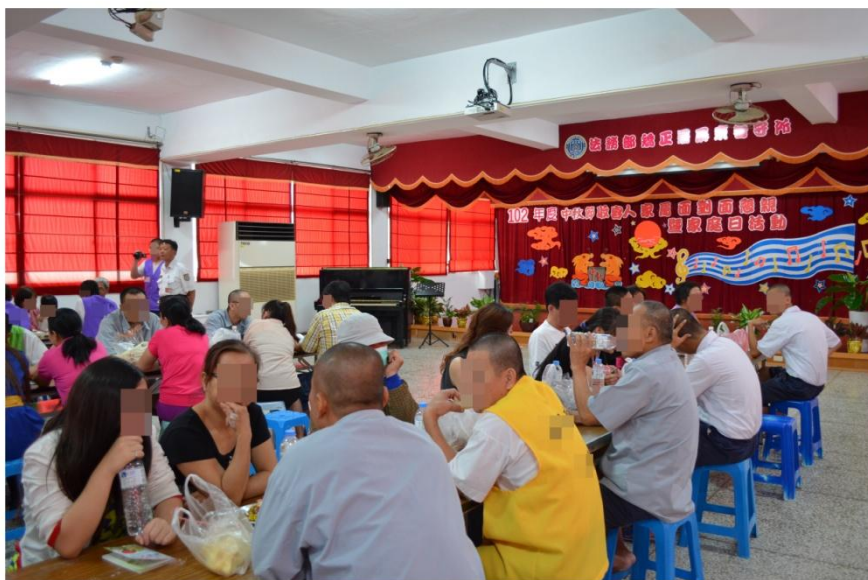
收容人與家屬面對面懇親活動情形

功專線」等戒毒宣導與「家庭日」等各類富教化意義之活動，場面熱鬧溫馨。此次共有家屬 111 名，收容人 66 名參加。