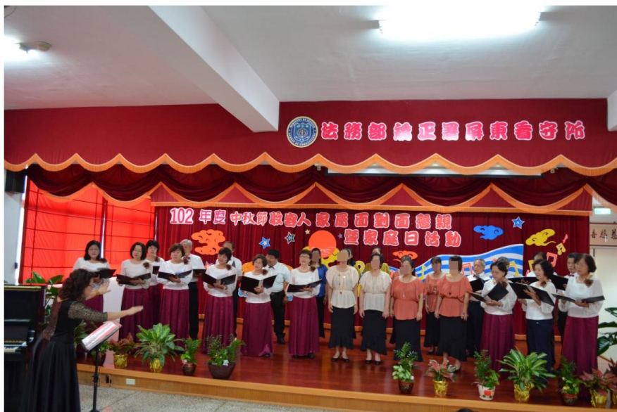
靜思合唱班成員與阿猴城合唱團演唱「伊是我的寶貝」