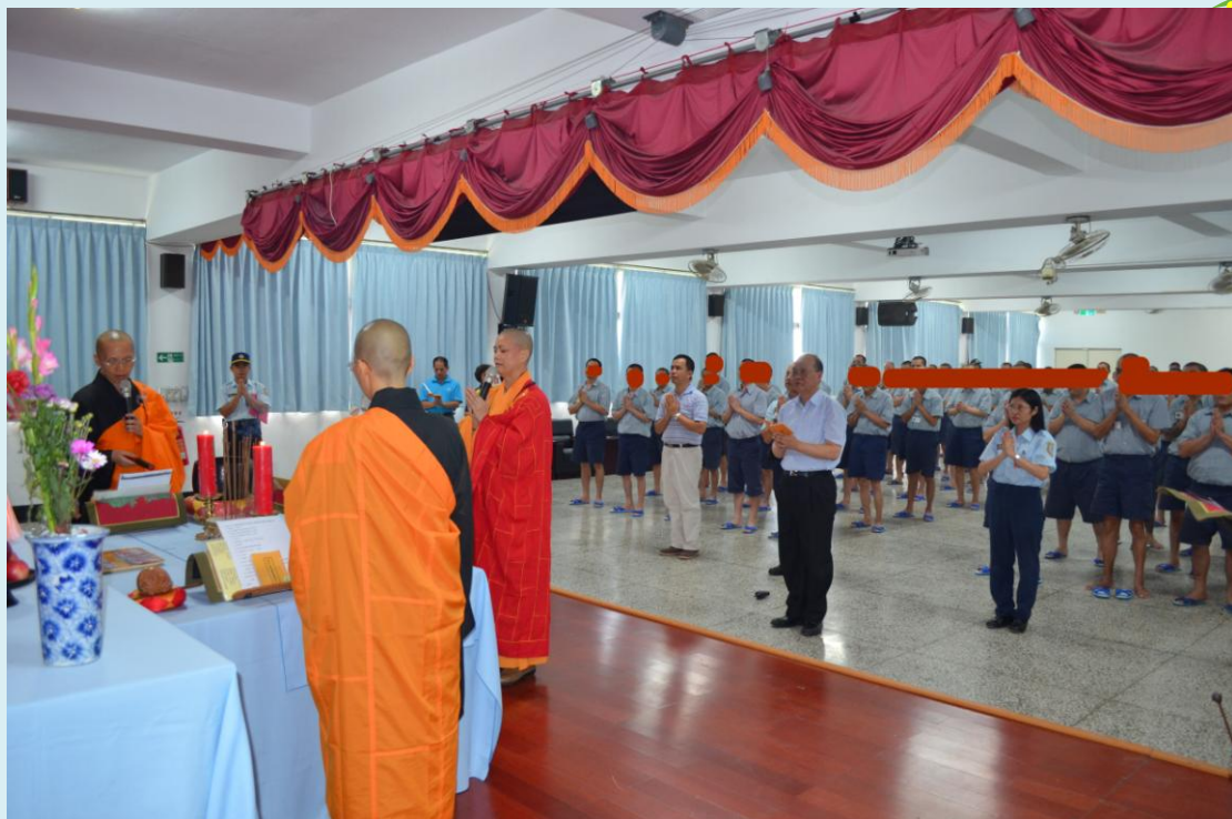
李所長振男率領各科室主管與會

舍灑淨，期望帶給收容人「慈悲」、「尊重」、「平安」的宗教 關懷，整場活動在所長頒贈感謝狀後，圓滿落幕。