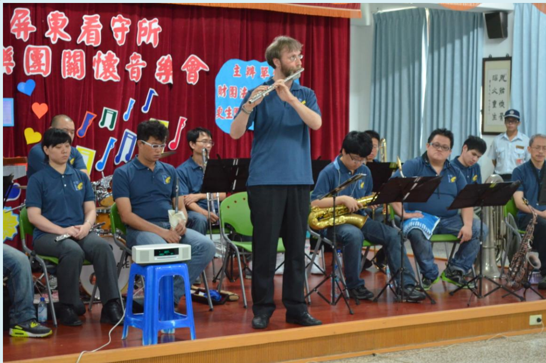
麥子管樂團成員一連串精湛演奏