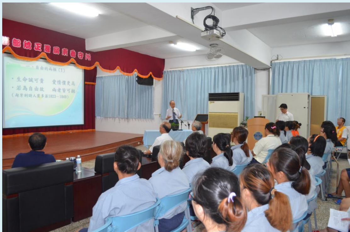
收容人聆聽前財政部白培英部長演講實況

最後，白長老為願意進一步了解耶穌基督福音的數十位收容人禱告，期盼所有人都能獲得真正的自由。