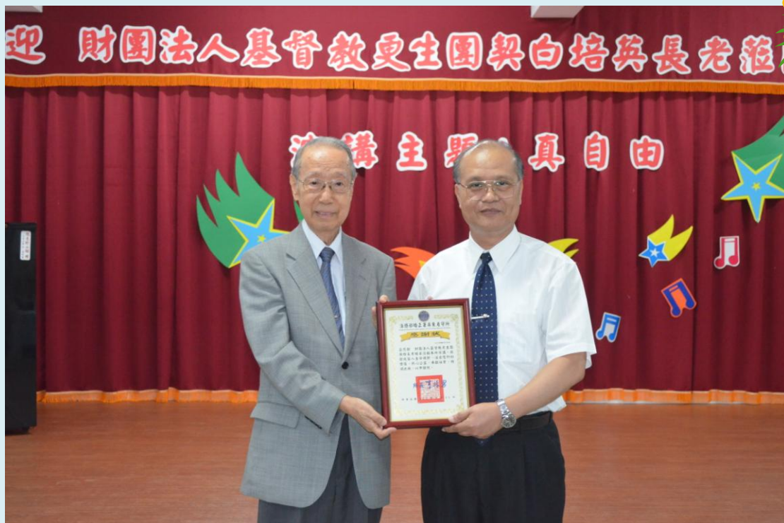
李振男所長致贈前財政部白培英部長感謝狀