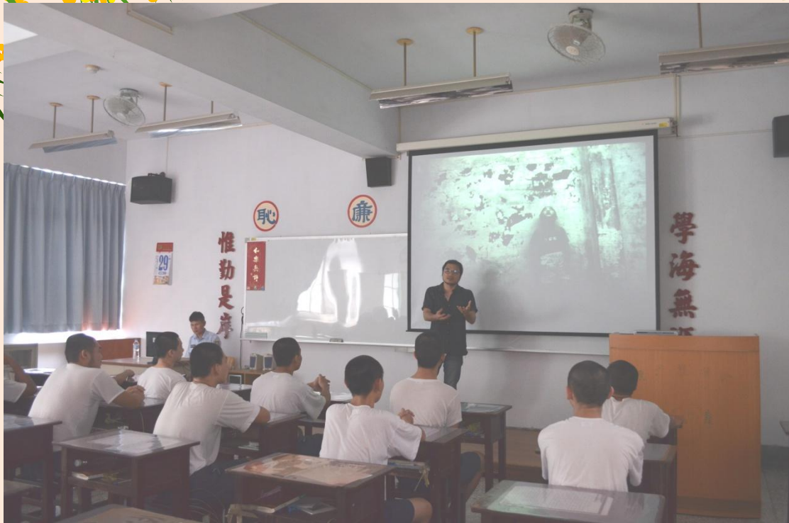
楊士毅先生流浪的動機及流浪中學習的生活體驗