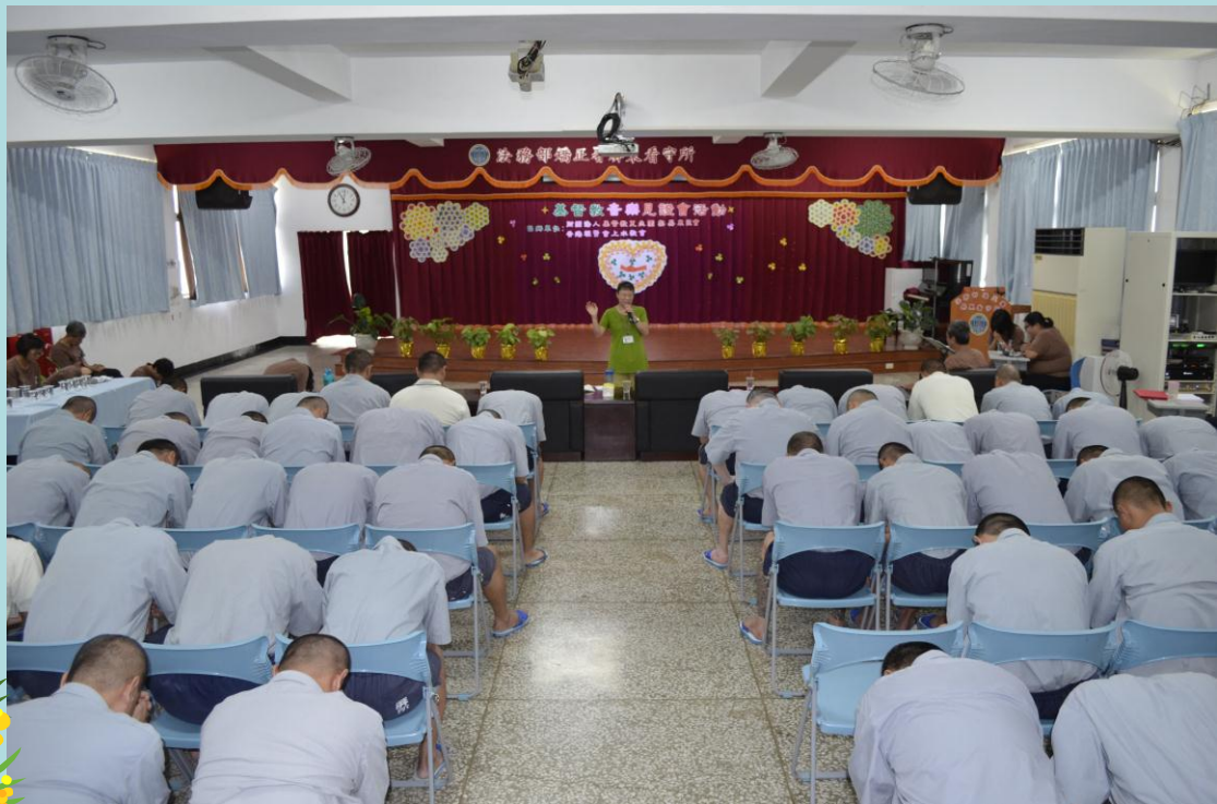
高招治牧師於活動尾聲--引領禱告、祝福