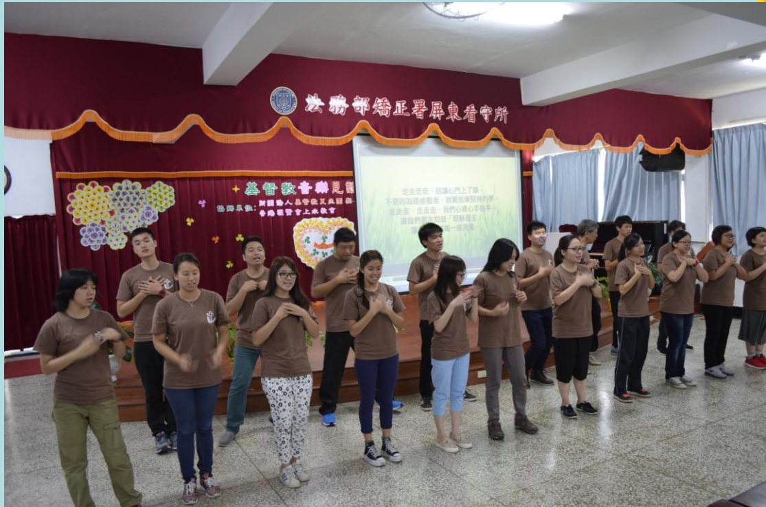
香港禮賢會上水教會牧師、傳道、事工獻唱詩歌