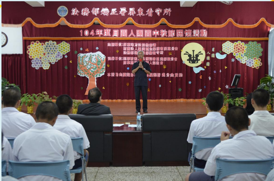
杞炎烈所長致詞勉勵與會人員實景